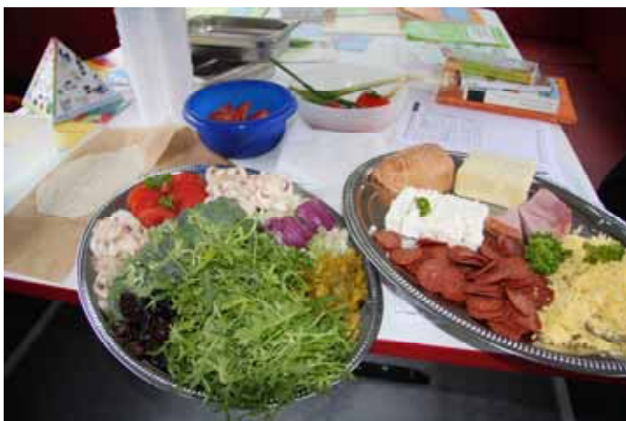
Der Pizzabelag ..... Kohlenhydrate, Fette, Eiweiße