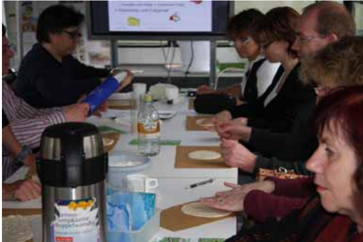
Der Pizzateig ..... Das Getreidekorn